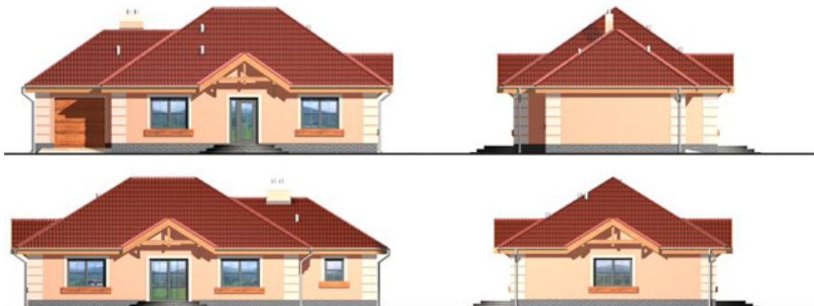
128 С 114 - Дома 100-150 м2