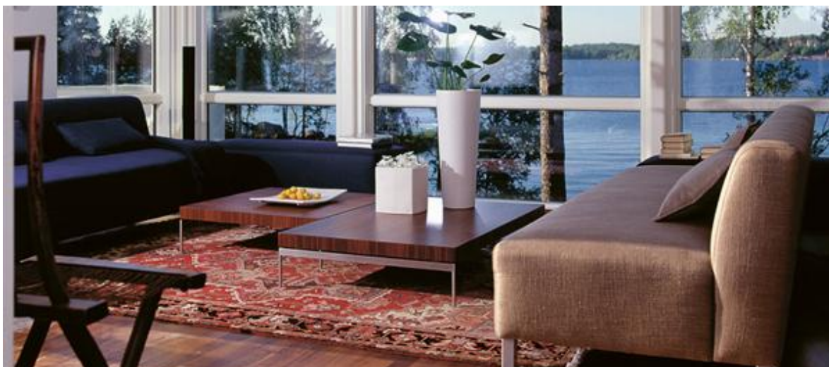
Горная сосна 93 - Дома 40-100 м2