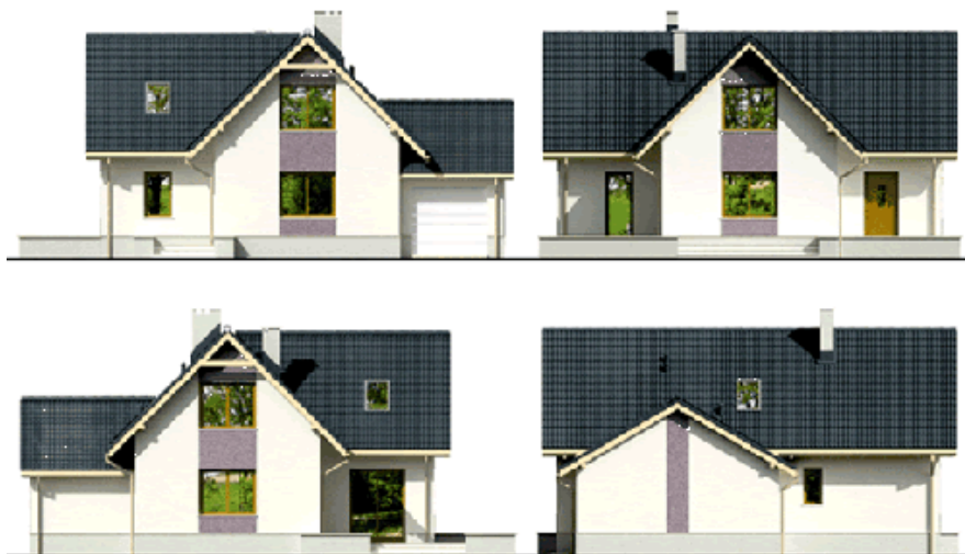
139a LMP 112 - Дома 100-150 м2